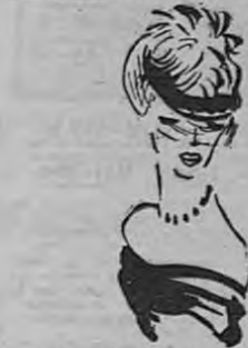
Toca de paja gris con la copa hecha de pétalos amarillos (Creación Jean Dessès).