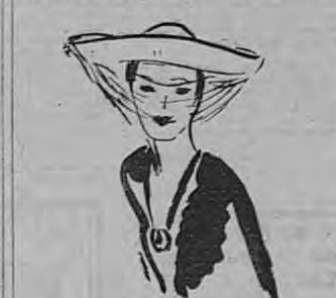
Gran fieltro blanco con bordes levantados y vollo de til negro colocado en forma de triángulo (Creación Jean Dessès).