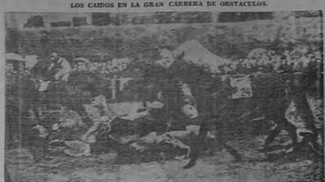
Este caso resultó de la salida de ocho caballos y de sus jockeys en el primer salto en la Gran Carrera de Obstáculos de Aintree, en Inglaterra, el 7 de Abril. Entre los caídos están "Land Fort", "Revelled", "Cadamstown", "Finarro", "Irish Lizard", "Texas Dan" y "Halsbridge Rock". El caballo en línea "St. Stockman" de los 36 que completaron en la muy difícil carrera de 4 millas y 2 furlongs...