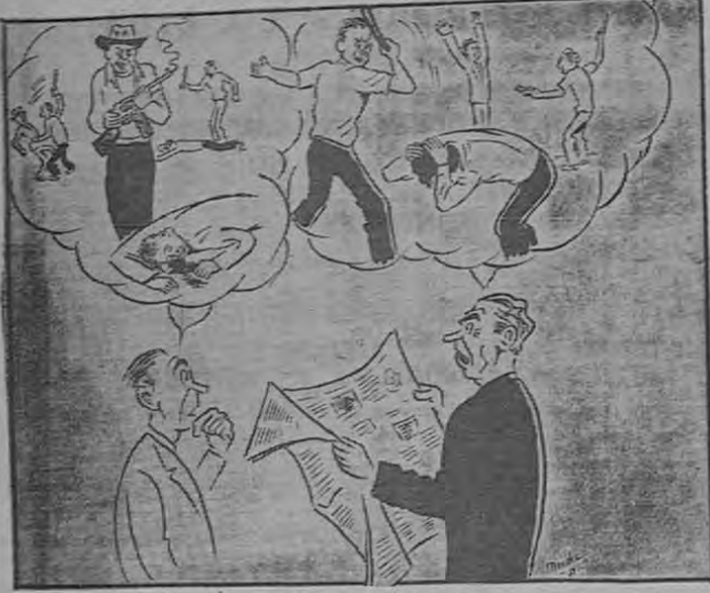
—Visto que los comunistas pretendían desfilir el Primero de Mayo?— —Vivir para ver... Pareciera que repentinamente sufrieron un ataque de AMNESIA...