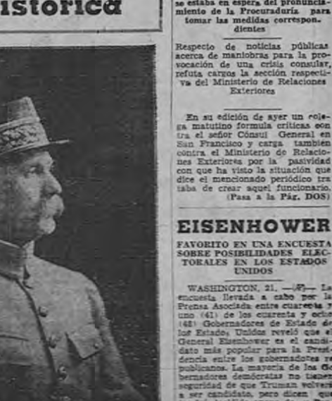
Este es el Petain de los tiempos gloriosos, cuando fue aclamado por los pueblo, como Héroe Salvador de Francia, durante la Primera Guerra Mundial. Ahora, amado, decadente, enemigo y preso, espera por momentos la cita con la patria, en su lejano prisión de la Isla de Yeu.